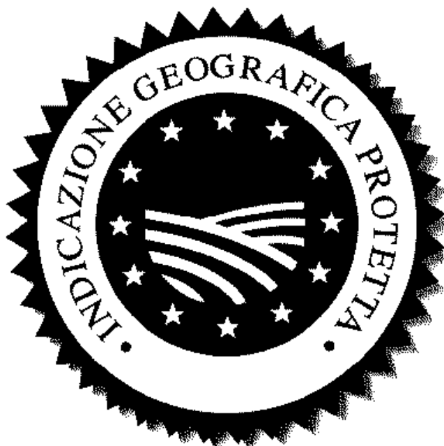
INDICAZIONE GEOGRAFICA PROTETTA