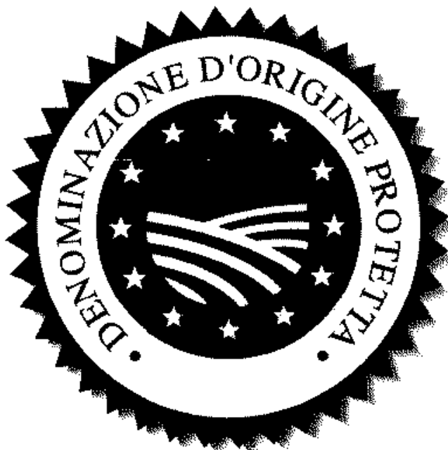
DENOMINAZIONE D'ORIGINE PROTETTA

È stata incorporata una rappresentazione grafica di solchi di un campo arato come riferimento all'origine geografica dei prodotti contrassegnati da questi logo.