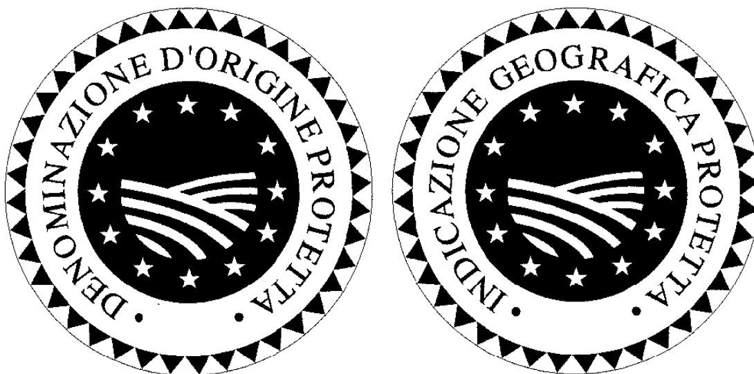
LOGO SU SFONDO COLORATO

Se il logo viene utilizzato a colori su sfondi colorati che rendono difficile la sua lettura, si dovrà utilizzare un circolo che delimita il contorno del logo per migliorarne il contrasto rispetto al colore dello sfondo.